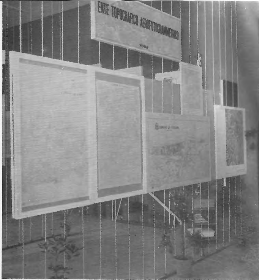
FIG. 6. - Esposizione degli elaborati dell'E.T.A. (Roma).