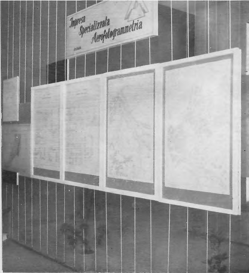
FIG. 7. - La mostra dei lavori della I.S.A. di Roma.