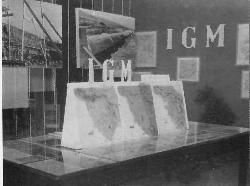
FIG. 4. — Esposizione dei lavori dell'I.G.M.: Carta speciale di Cortina d'Ampezzo (1 : 25000); Carta del K2 (1 : 12500); Carta del M. Bianco (1 : 25000); Plastici in vinilite (1 : 100000 e 1 : 200000); 16 tavole relative ad un esempio di « chiave di foto-interpretazione topografica-geografica » elaborato dal T. Col. G. Schmidt dell'I.G.M.