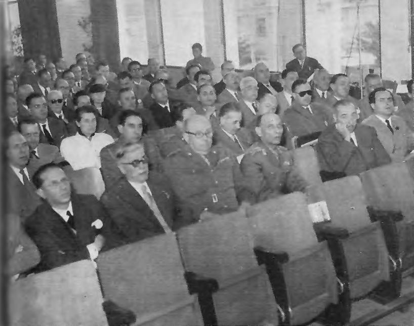
FIGG. 17-18. - Scorci della sala delle conferenze alla Fiera del Mediterraneo durante la presentazione delle comunicazioni.