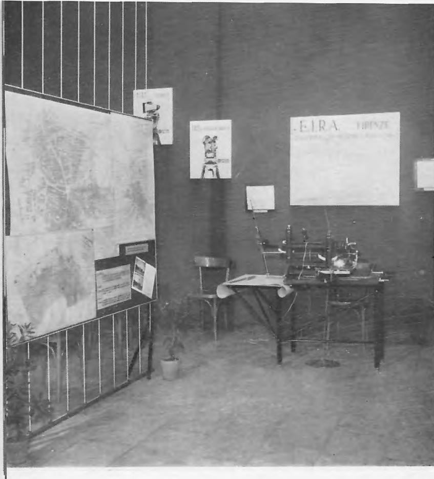
FIG. II. - Uno scorcio del padiglione dell'E.I.R.A. e delle OFFICINE GALILEO di Firenze. Rilievi vari e strumentazione Santoni.