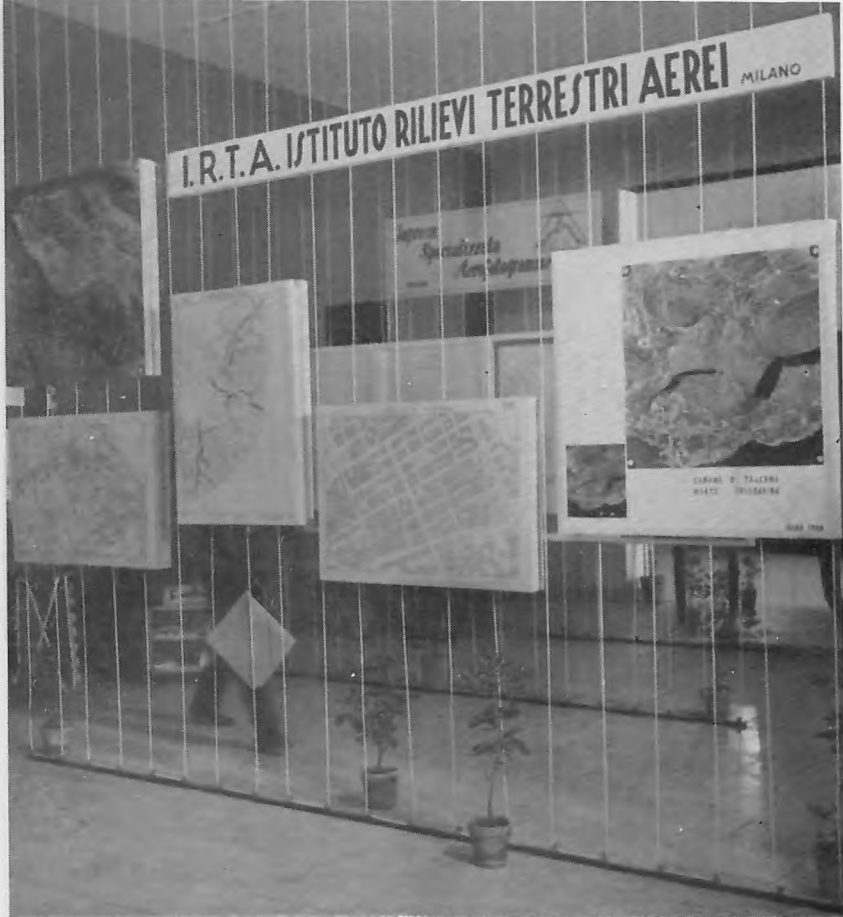
FIG. 5. - Saggi di produzione cartografica tecnica dell'I.R.T.A. (Milano). Rilievo alla scala 1:1000 del centro abitato di Palermo, rilievo alla scala 1:2000 del territorio comunale di Palermo, carta geologica alla scala 1:2000 del corso medio del fiume Simeto, ingrandimenti fotografici alla scala 1:2000 del monte Pellegrino e di una parte della città di Palermo.