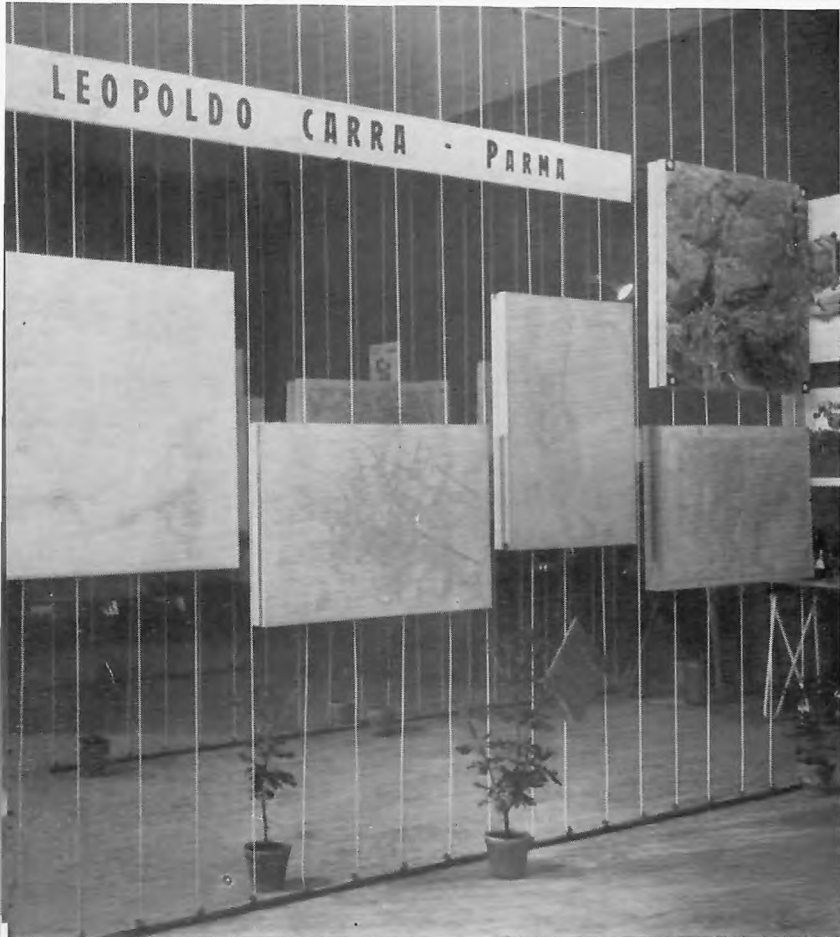
FIG. 9. — La mostra dei lavori dell'Ufficio Tecnico Leopoldo Carra di Parma: Rilievo afg. «Comune di Foggia», Autostrada Milano-Roma-Napoli, Piano di Catania (1 : 2000); Comune di Reggio Emilia (1 : 5000); rilievo afg. del fiume Po, da Pavia al mare (1 : 50000); ingrandimento 80 × 80 di un fotogramma 23 × 23 eseguito con camera Wild RC5, f = 152 mm.