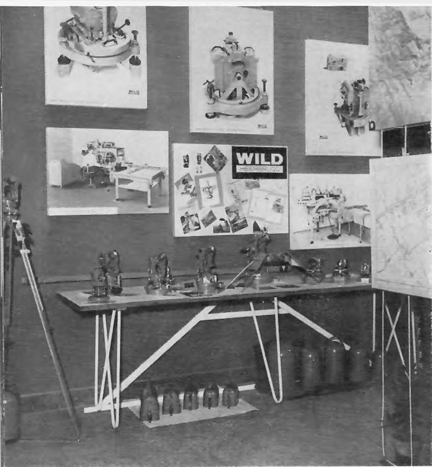
FIG. 13. - Visione di insieme della esposizione degli strumenti topografici e fotogrammetrici della Casa Wild, di Heerbrugg (Svizzera).