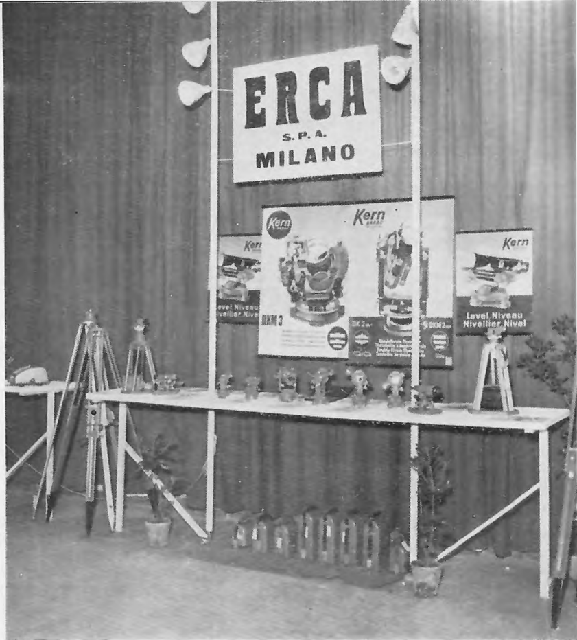
FIG. 12. - Gli strumenti topografici e geodetici della Casa E.R.C.A. di Milano (Strumentazione Kern).