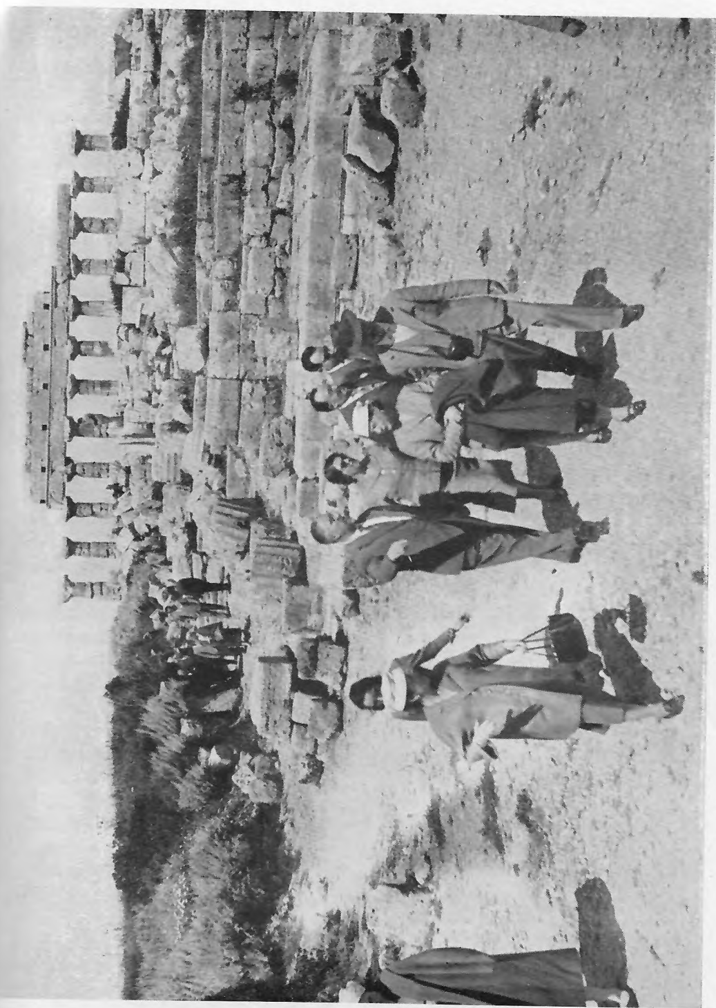
FIG. 21. - I gitanti in visita a Selinunte.