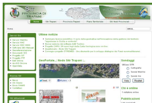
Figura 1. Home page del Portale Cartografico del libero Consorzio comunale di Trapani.

Il libero Consorzio comunale di Trapani ha attivato il proprio SIT contestualmente alla redazione del Piano Territoriale Provinciale ex art. 12 della Legge Regionale n. 9/86. Al fine di rendere disponibili in un unico portale, sia l'attività legata alla pianificazione territoriale che quella legata al relativo SIT, è stato pubblicato il Portale Cartografico Territoriale della Provincia regionale di Trapani (Putaggio, 2013) (Fig.1).