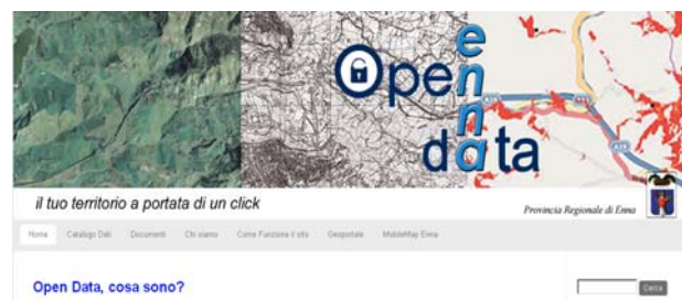
Figura 4. Il Portale Open Data Territorio Enna.

Al fine di massimizzare la condivisione e diffusione dei dati sono stati realizzati i seguenti portali: il Geoportale, un WebGIS per la consultazione di dati su territorio, viabilità, servizi sanitari, popolazione, strutture produttive ed altro ancora con la possibilità di ottenere informazioni georiferite e poterle stampare; il sito del Piano Territoriale Provinciale, dove è possibile visualizzare con completezza e continuità l’iter di definizione dell’importante strumento di pianificazione territoriale provinciale e scaricare tutta la cartografia di progetto; il portale dei dati aperti “Open Data Territorio Enna” (Fig. 4) (opendataterriorioenna.it), dove l’ente assume come cardine il concetto di democrazia partecipata, nella convinzione che i dati pubblici debbano essere fruibili ed usabili da tutti.