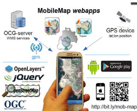
Figura 5. Architettura delle app MobileMap.

Le web app sono state implementate ricorrendo ad OpenLayers, framework Javascript, rilasciato in BDS 2-Clause License (The FreeBSD Project, 1992), che offre funzionalità di visualizzazione interattiva di mappe all'interno di browser web. OpenLayers permette l'accesso a diversi dataset presenti in rete, quali, ad esempio, i servizi WMS, e consente, inoltre, di effettuare operazioni interattive su di essi. L'interfaccia web è stata realizzata ricorrendo a JQuery Mobile (Reid, 2011), framework Javascript open source finalizzato alla costruzione di interfacce web touch-optimized . Le app ibride sono state implementate su piattaforma Android e sono scaricabili attraverso il market Google Play. Al fine di migliorarne la diffusione, sono state rese compatibili con le versioni di Android 2.2 (Froyo, API level 8) e successive. In questa implementazione, per consentire l'interfacciamento del codice Javascript con le componenti native del dispositivo Android, quali il sensore GPS, si è fatto uso del framework Apache Cordova, quest'ultimo rilasciato in licenza Apache 2.0 (Apache Software Foundation, 2004) (Fig. 5).